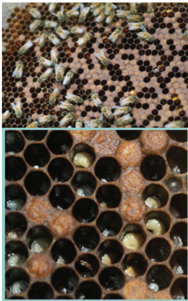
شمای قاب حاوی نوزادان مبتلا به بیماری لوک اروپایی